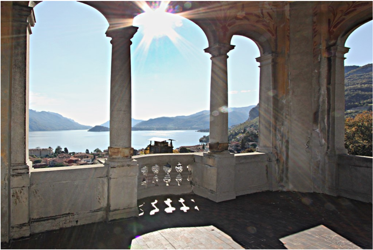
Объект: Резиденция гостиничного типа в Менаджо Расположение: Италия Озеро Комо Менаджо