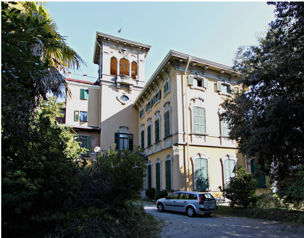
Объект: Резиденция гостиничного типа в Менаджо Расположение: Италия Озеро Комо Менаджо