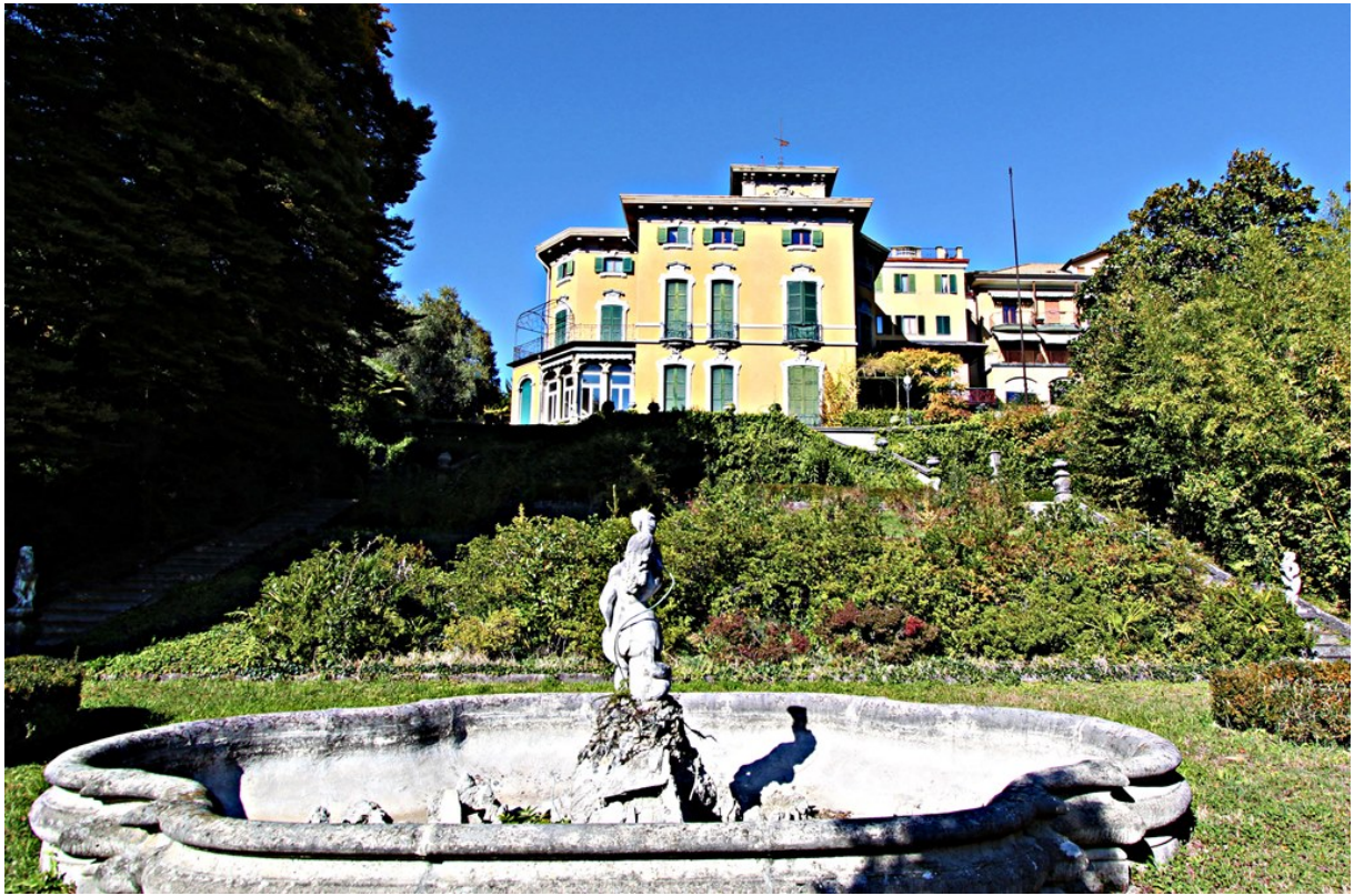
Объект: Резиденция гостиничного типа в Менаджо Расположение: Италия Озеро Комо Менаджо