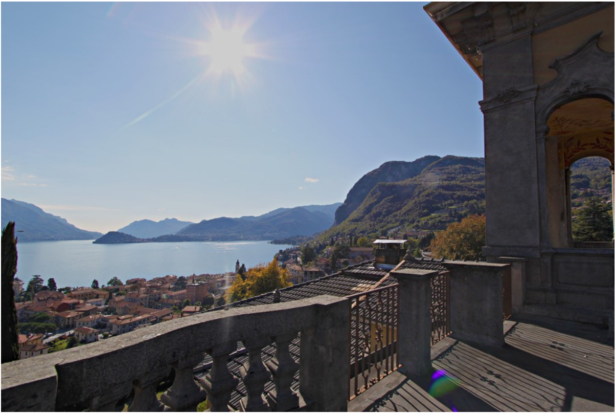
Объект: Резиденция гостиничного типа в Менаджо Расположение: Италия Озеро Комо Менаджо