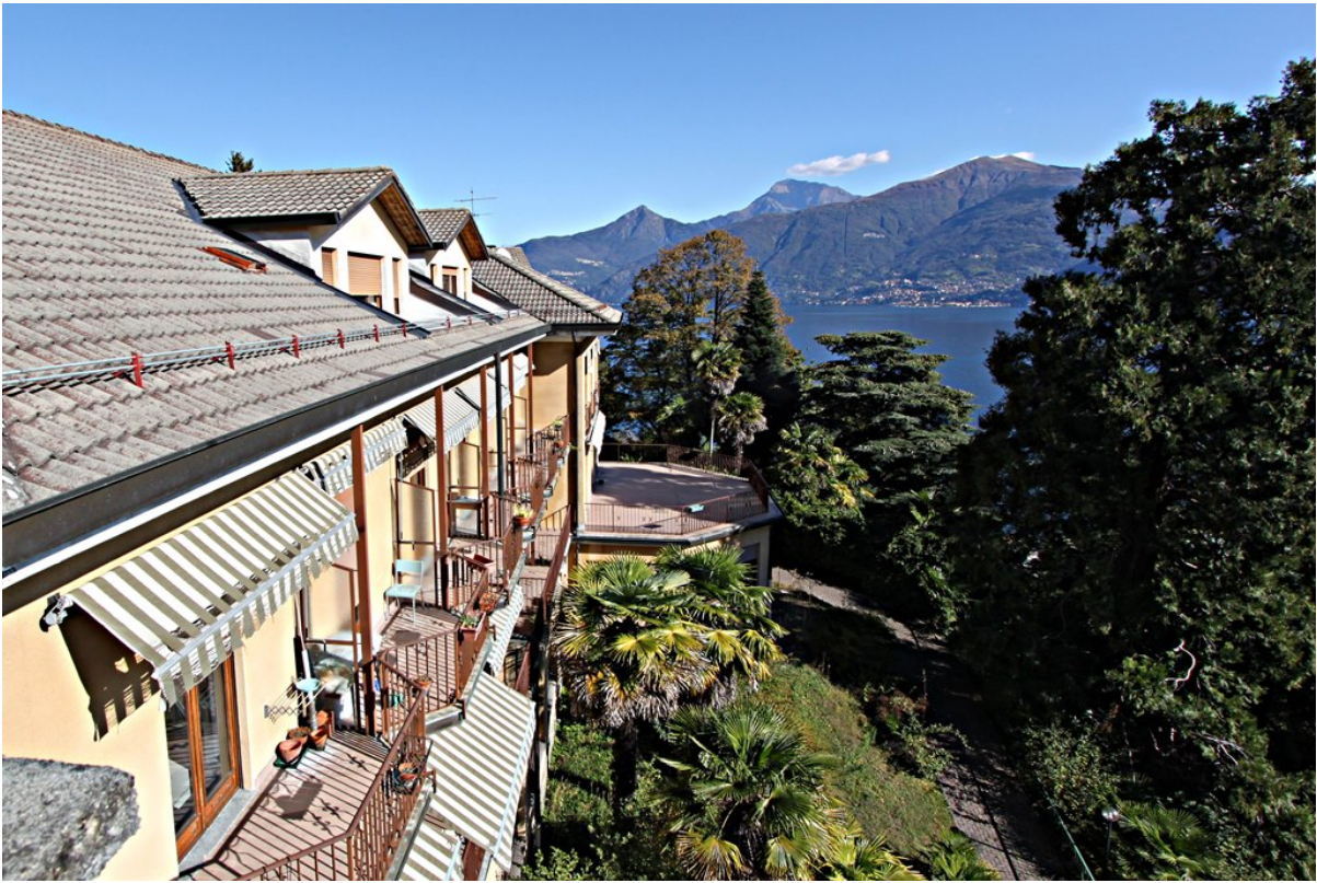
Объект: Резиденция гостиничного типа в Менаджо Расположение: Италия Озеро Комо Менаджо