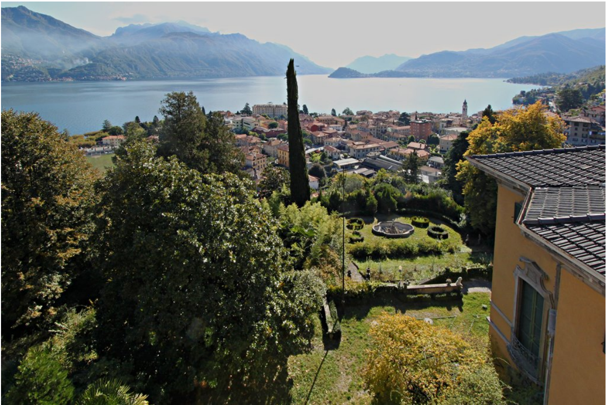
Объект: Резиденция гостиничного типа в Менаджо Расположение: Италия Озеро Комо Менаджо