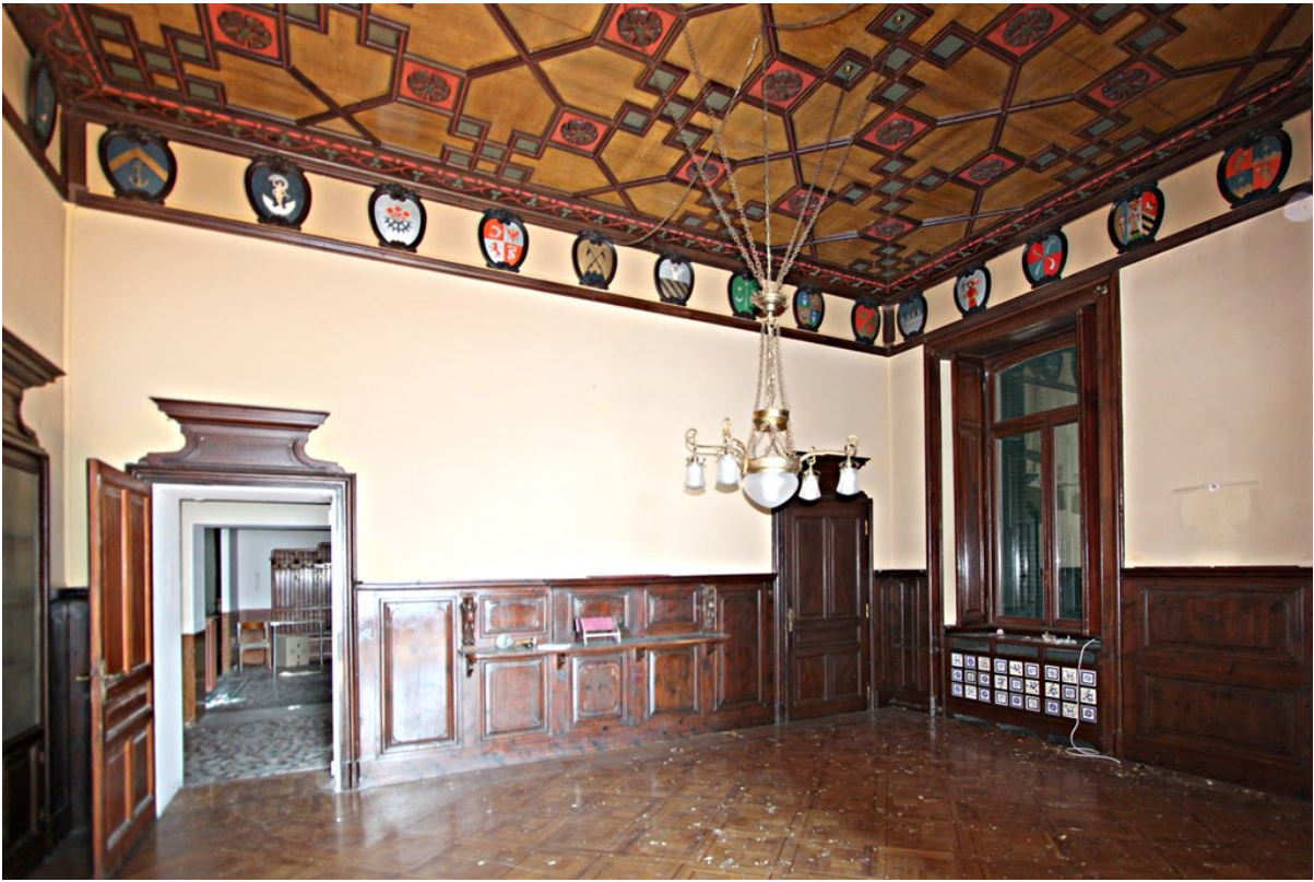
Объект: Резиденция гостиничного типа в Менаджо Расположение: Италия Озеро Комо Менаджо