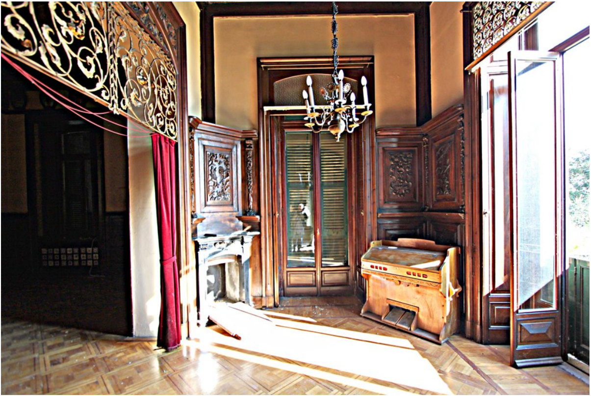
Объект: Резиденция гостиничного типа в Менаджо Расположение: Италия Озеро Комо Менаджо