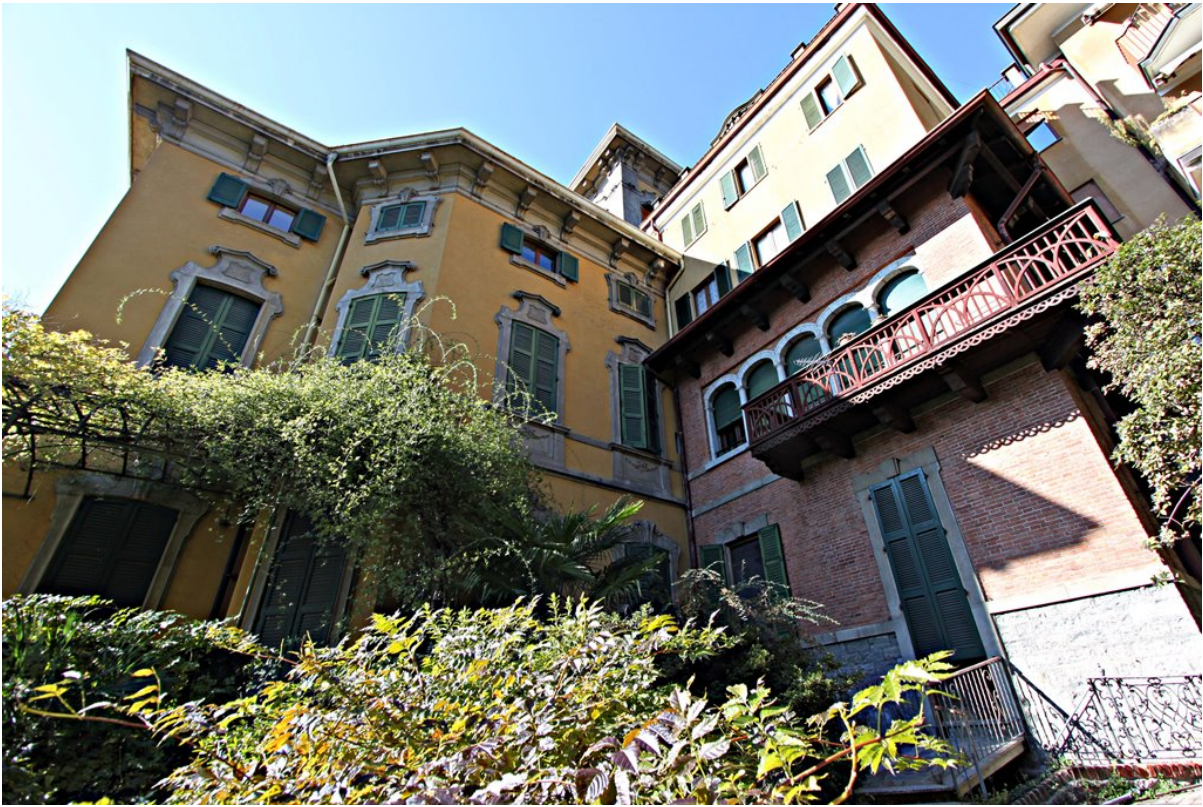
Объект: Резиденция гостиничного типа в Менаджо Расположение: Италия Озеро Комо Менаджо