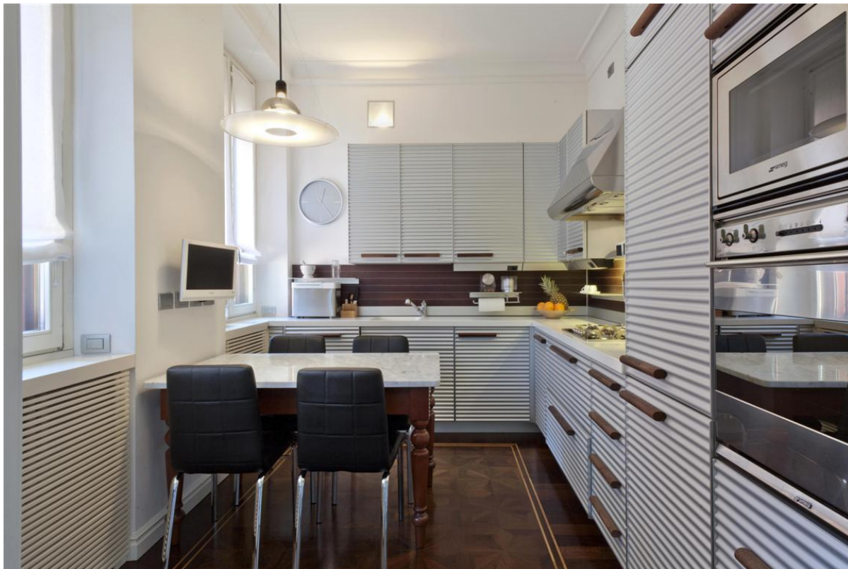
Объект: Уникальная квартира на центральной площади города Комо Расположение: Италия Озеро Комо Комо