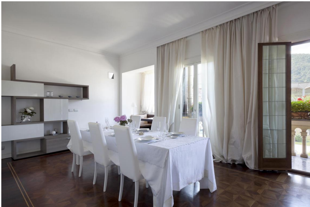
Объект: Уникальная квартира на центральной площади города Комо Расположение: Италия Озеро Комо Комо