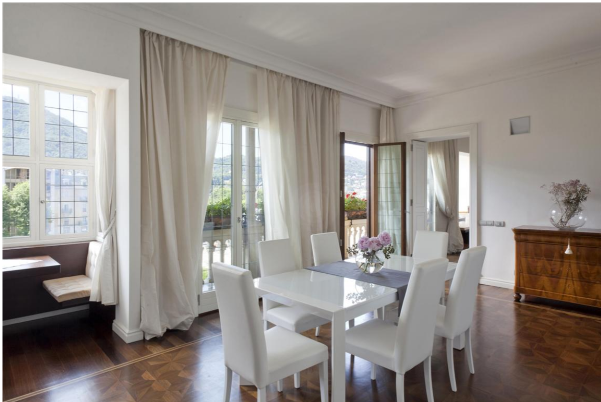
Объект: Уникальная квартира на центральной площади города Комо Расположение: Италия Озеро Комо Комо