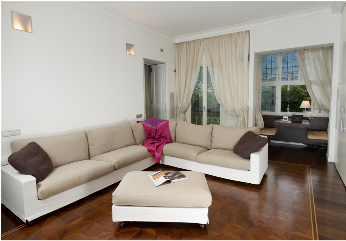
Объект: Уникальная квартира на центральной площади города Комо Расположение: Италия Озеро Комо Комо