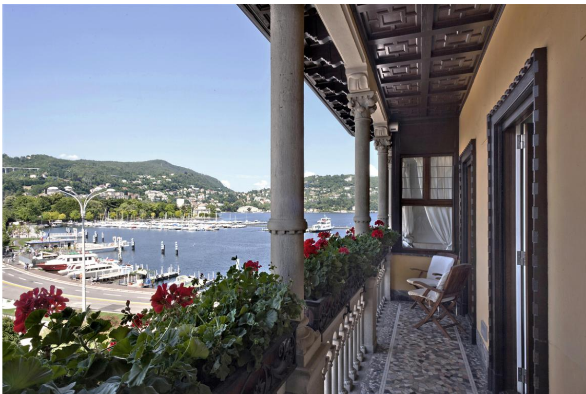
Объект: Уникальная квартира на центральной площади города Комо Расположение: Италия Озеро Комо Комо