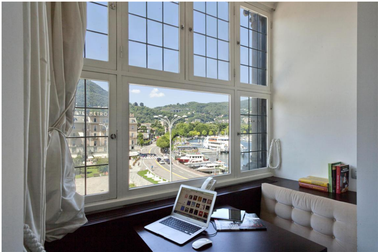
Объект: Уникальная квартира на центральной площади города Комо Расположение: Италия Озеро Комо Комо