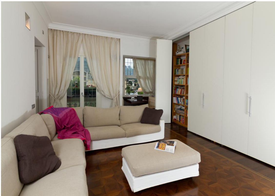
Объект: Уникальная квартира на центральной площади города Комо Расположение: Италия Озеро Комо Комо