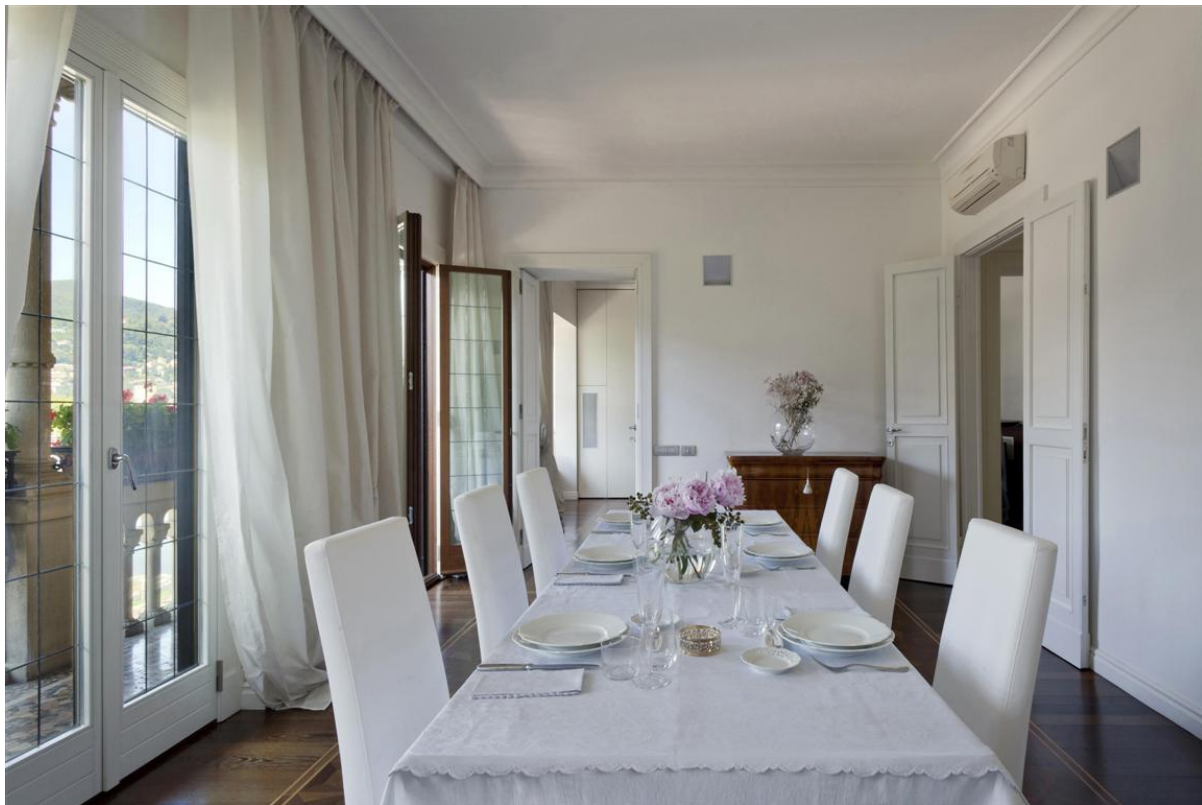
Объект: Уникальная квартира на центральной площади города Комо Расположение: Италия Озеро Комо Комо