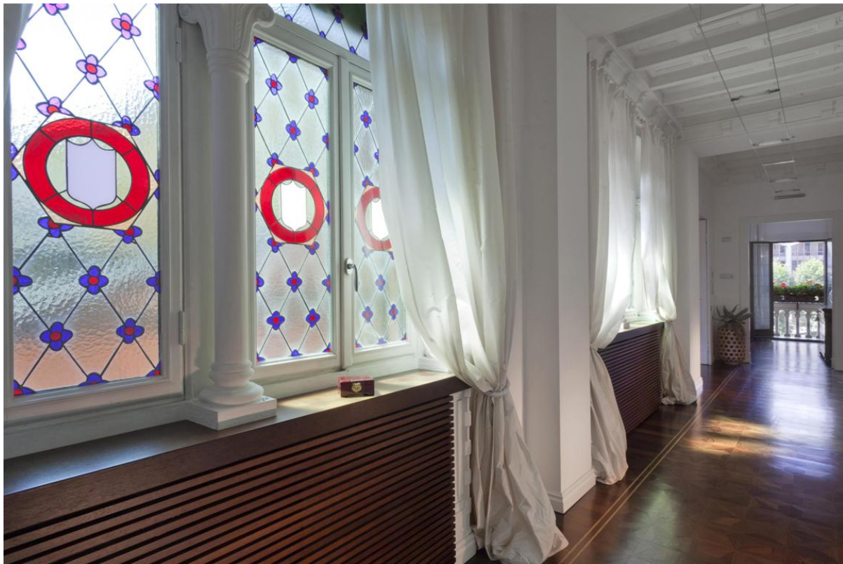
Объект: Уникальная квартира на центральной площади города Комо Расположение: Италия Озеро Комо Комо