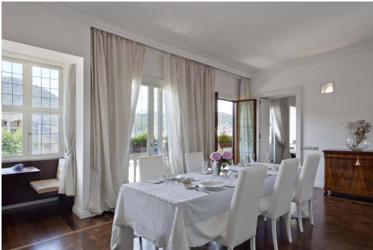
Объект: Уникальная квартира на центральной площади города Комо Расположение: Италия Озеро Комо Комо