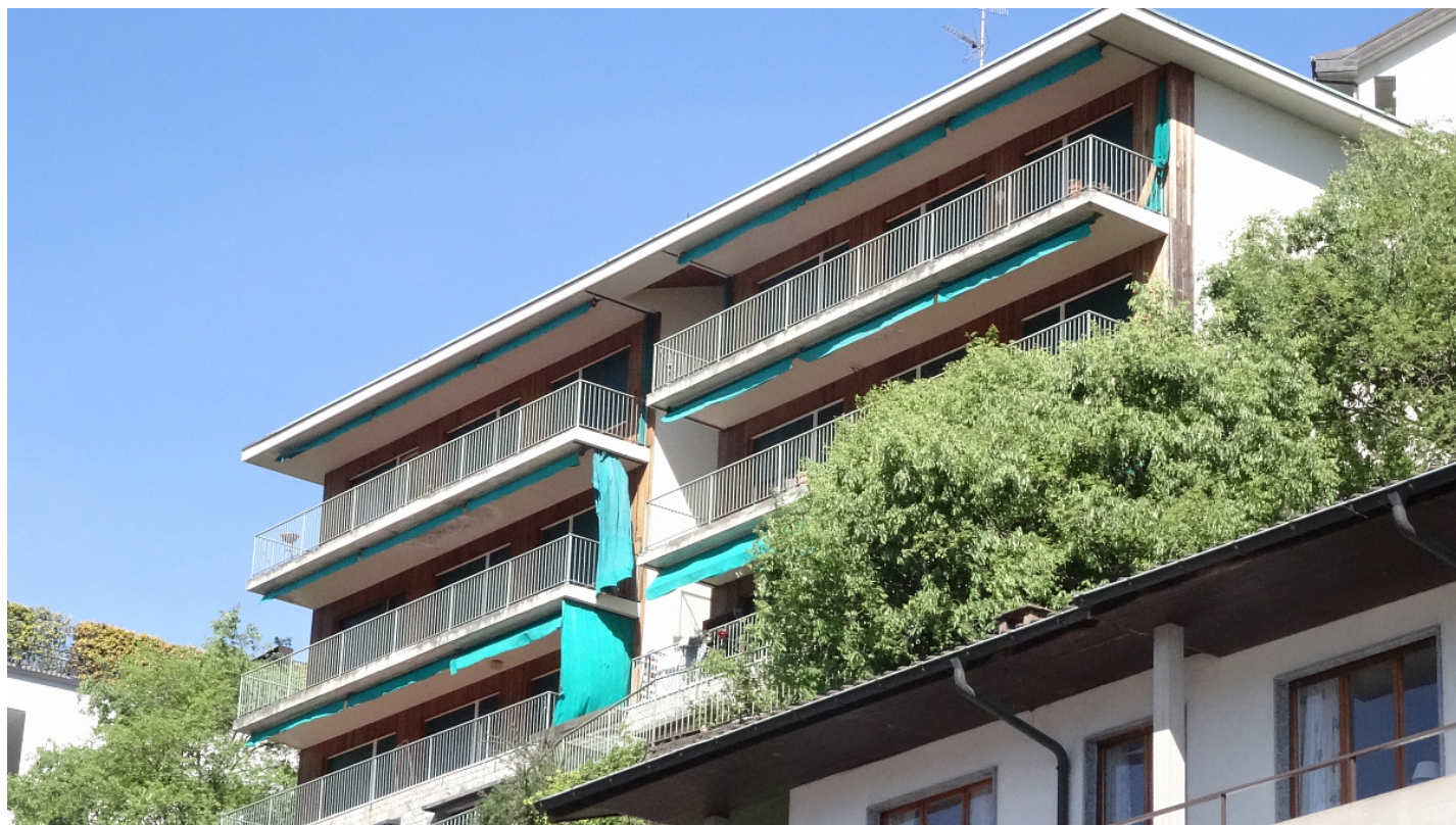
Объект: Резиденция на 8 квартир в Кампоне Расположение: Италия озеро Лугано Кампоне-д'Италия