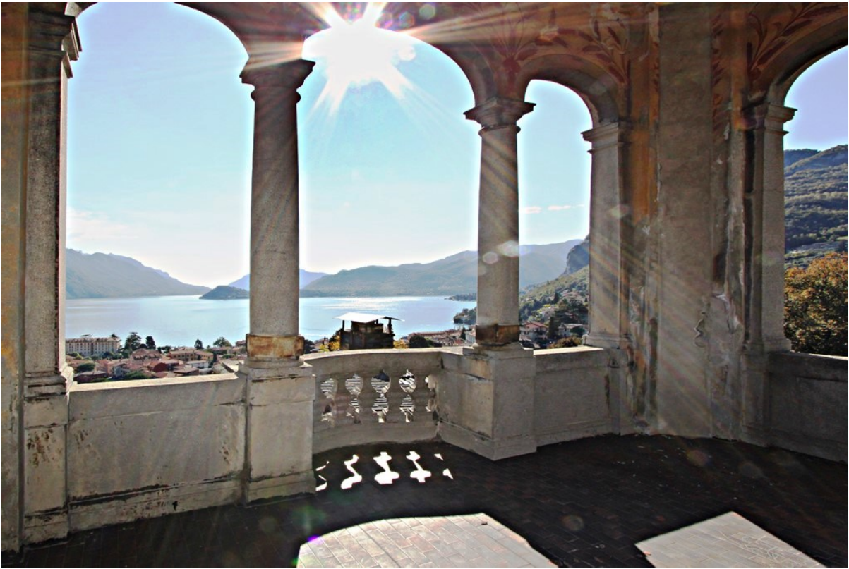
Объект: Резиденция гостиничного типа в Менаджо Расположение: Италия Озеро Комо Менаджо