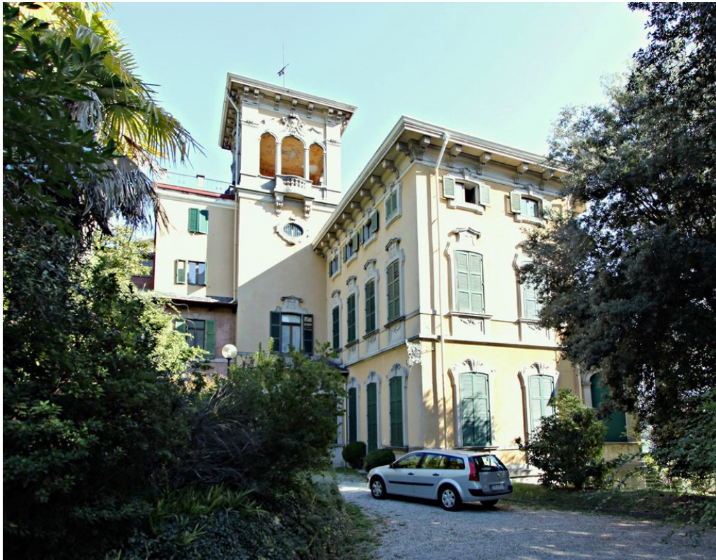
Объект: Резиденция гостиничного типа в Менаджо Расположение: Италия Озеро Комо Менаджо